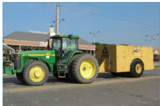
Foto 3. Equipo pesado de compactación para pavimentos fracturados

Esta técnica se utiliza con pavimentos de hormigón donde la capacidad estructural no está seriamente afectada pero que pueden tener defectos funcionales que afecten su regularidad como desconchados, reparaciones, etc. Si la actuación se realiza sobre pavimentos con juntas armados, las cargas a aplicar son muy superiores pues es necesario romper la adherencia armadura-hormigón lo que permite disminuir los movimientos relativos en juntas y grietas. Las cargas tan altas necesarias para esta tarea tiene un efecto negativo