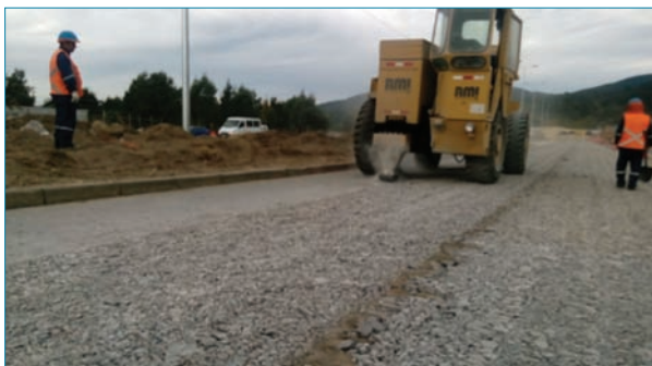
Foto 5. Equipo de desintegración por resonancia. (Fuente: Sacyr).

El coeficiente estructural de una base granular se considera habitualmente 0.14 y el del material de la losa desintegrada puede alcanzar fácilmente 0.22 y llegar en ocasiones hasta 0.28. En el proceso de desintegración además se busca que la rotura se produzca de tal forma que no existan trozos de la losa que penetran excesivamente en la base inferior para lo que se intenta limitar el movimiento entre los distintos trozos. El patrón de rotura producido por el equipo de vibración es en forma de puzzle de forma que todos los trozos están encajados unos con otros. Esto es lo que produce una mayor distribución de las cargas hacia la capa inferior ya que las piezas trabajan de forma conjunta. Esto solo se puede conseguir aplicando una carga de baja amplitud y alta frecuencia mediante vibración por resonancia. Uno de los inconvenientes de realizar esta rotura controlada del hormigón limitando el daño que se ejerce sobre él es que el espesor de losa que se puede desintegrar es limitado. En los casos habi-