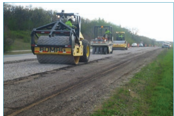
Foto 7. Tren de trabajo con equipo de desintegración por impactos. El rodillo especial de rotura, en primer plano.

Cuando se diseña un refuerzo de mezcla sobre un pavimento de hormigón, se analizan varios criterios de fallo entre los que se encuentra la aparición de grietas por reflexión. Como se ha venido comentando, si se realiza una actuación previa de rotura de losas se supone que no es necesario tener en cuenta la reflexión de grietas y juntas para el diseño. De hecho, los métodos y normas existentes no abordan este modo de fallo, enfocando el problema solamente desde el punto de vista estructural. A continuación se describen los métodos que se utilizan más habitualmente para el diseño de este tipo de refuerzos.