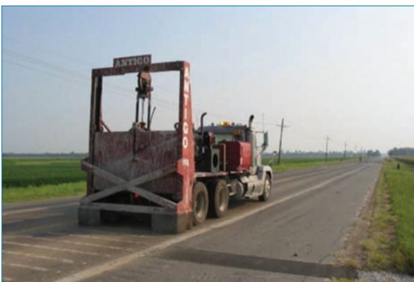
Foto 2. Equipo tipo guillotina para fracturación de pavimentos de hormigón

El principal objetivo de esta técnica es reducir la acumulación de movimientos horizontales hasta un nivel admisible por la capa de mezcla que se extenderá como refuerzo. Para conseguir esto, se utilizan equipos que actúan por impacto golpeando las losas y reduciéndolas a trozos de 0.3-1.0 m de longitud ( crack ). Los equipos utilizados en la actualidad para la fase de fracturación ( crack ) pueden ser de tipo guillotina o de tipo martillo múltiple (Foto 2). Estos equipos son vehículos autopropulsados que elevan una masa muy pesada hasta 2,5 m de altura y la dejan caer para impactar contra la superficie del pavimento. La idea de mantener un tamaño de trozo de losa no demasiado pequeño es buscar el equilibrio entre conservar cierta capacidad estructural y minimizar los movimientos en cada junta/grieta. Lo ideal es conseguir que la fracturación genere grietas finas que permitan mantener la transferencia de carga entre sus bordes y así mantener una la mayor capacidad portante posible.