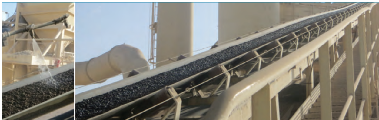
Figura 1 y 2: Adición de rejuvenecedor en frío sobre RAP y su transporte en planta.