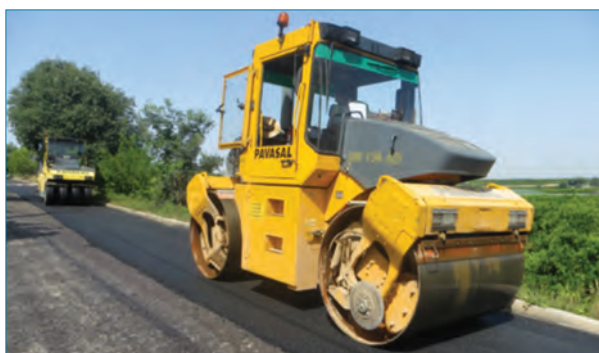
Figura 3: Compactación del material en obra.