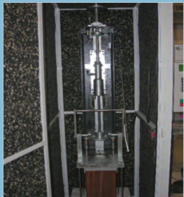
Compactador de impacto (UNE-EN 12697-30).