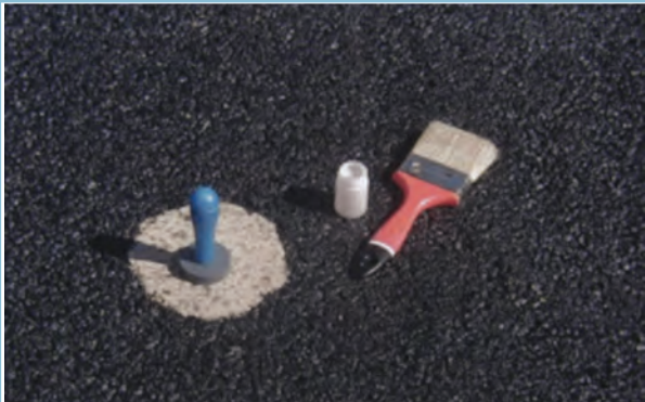
Medida de la macrorrugosidad (UNE-EN 13036-1).

contenido de huecos, sensibilidad al agua, deformabilidad, etc, siguen dentro de los valores especificados en los Pliegos.