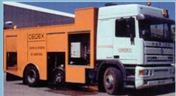
Resistencia al deslizamiento según la UNE 41201 IN.

En cuanto a la resistencia al deslizamiento, cabe decir que al ser una determinación en la que lo que se mide es el contacto árido – neumático, el resultado está muy condicionado a la estacionalidad de la medida, dándose el caso de que si la superficie de aquél está contaminada por partículas de polvo, barro, etc, el resultado obtenido varía sensiblemente, pudiéndose obtener resultados que cumplen la normativa o no, en función de la época en la que se realice la determinación.