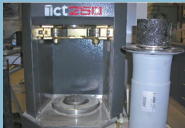
Compactador giratorio (UNE-EN 12697-31).