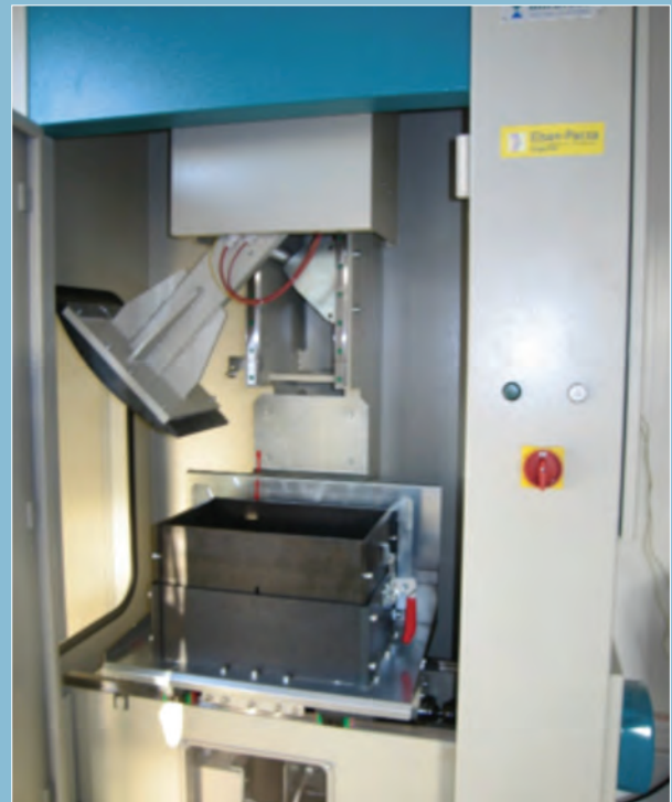
Compactador de placa (UNE-EN 12697-33).

muchos problemas en obra el verificar que ante dispersiones en la granulometría y en el contenido de ligante que pueden producirse durante la fabricación, aún dentro de las tolerancias admitidas en los Pliegos, el resto de propiedades de la mezcla como