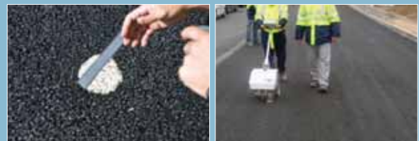
Medida de la macrotextura Medida rápida del IRI (IRIS 2000).