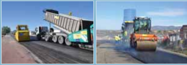
Distintos equipos de compactación en tramos de prueba fuera de la carretera a pavimentar.