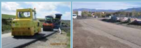
Tramo de prueba en la misma obra a ejecutar y en una superficie fuera de la carretera de la obra.

Siempre que sea posible, es recomendable realizar el tramo de prueba sobre la superficie a pavimentar, con los mismos equipos y condiciones de trabajo y climatológicas.