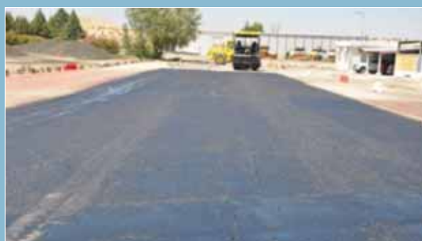
Preparación de la superficie para realizar un tramo de prueba.