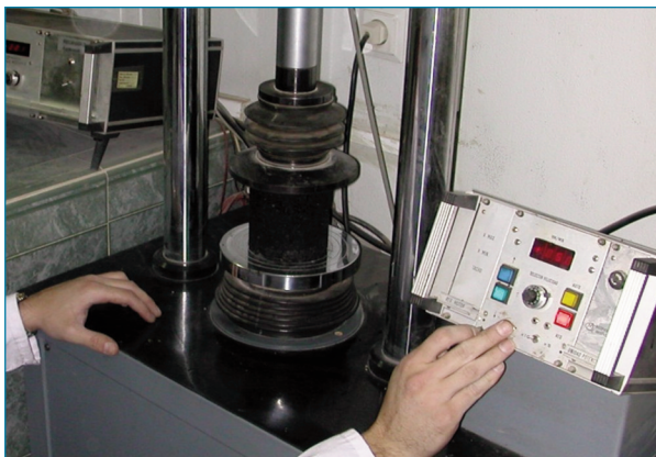
Foto de rotura de probetas a compresión simple.

El ensayo de compresión simple se efectúa en un tiempo inferior a 2 minutos tras la extracción de cada probeta del sistema de acondicionamiento, midiendo la fuerza para el lote de probetas húmedo y el lote de probetas seco.