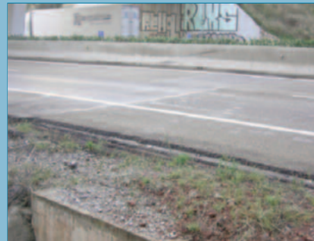
Escalón producido por la presencia de una estructura.