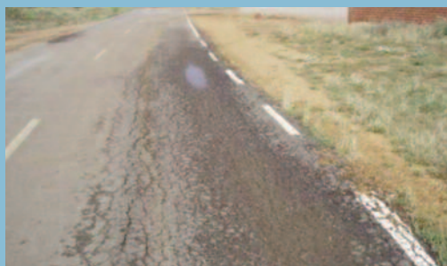
Surgencias de agua y finos como consecuencia de zahorra plástica y falta de drenaje longitudinal