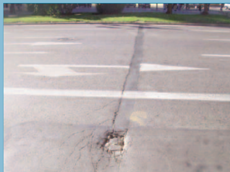
Escalón producido por asentamiento de zanja mal reparada