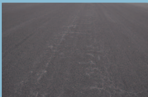
Surgencias de finos y agua en distintos tipos de firmes