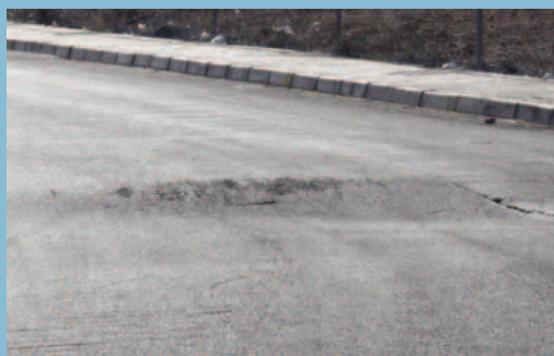
Escalón localizado en un punto de la vía.