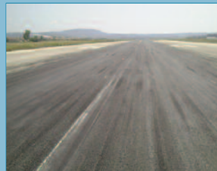
Depósitos de caucho de los neumáticos en la zona de toma de tierra de pistas de vuelo de aeropuertos