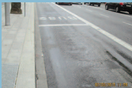
Diversos casos de vertidos de combustibles y su afección al firme