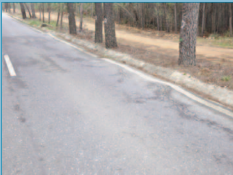
Escalones producidos por afeción al firme de las raíces de los árboles próximos a la carretera

En el caso de deberse a la transición del firme normal, con capas granulares, a la estructura, losa de hormigón, una buena solución es construir las denominadas losas de transición que evitan el asentamiento del material granular escasamente compactado junto a la estructura.