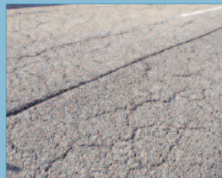
Agrietamiento de la capa de rodadura afectada por el vertido de sales como tratamiento anti hielo y las bajas temperaturas