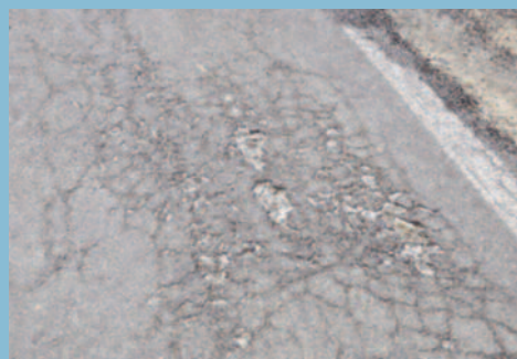
Baches producidos por causas relacionadas con la puesta en obra