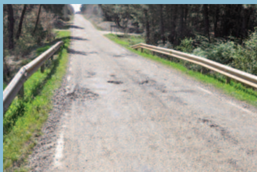
Imágenes de distintos tipos de baches.