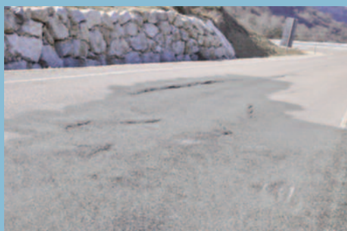
Escalones debidos a asentamiento localizado de las capas inferiores