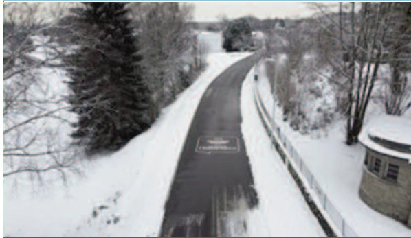
Figura 17. Aspecto de la calle en invierno

fontanería y electricidad, en las inmediaciones de la obra. Una cabina de control permite el control y regulación de los intercambios de calor con la red de calefacción comunitaria.