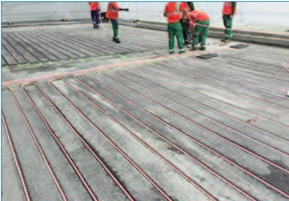
Figuras 8 y 9. Instalación de los tubos mediante ranurado

Si la instalación se realiza sobre una calzada existente, será necesario fresar únicamente la capa de rodadura, procediendo a ranurar directamente la capa intermedia. La extensión y compactación de la capa de rodadura es similar para los dos métodos de instalación de los tubos.