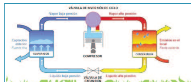
Figura 1. Ejemplo de funcionamiento de una bomba de calor geotérmica

Supongamos una bomba de calor/aire acondicionado doméstica. En el punto inicial, el fluido refrigerante que circula por el circuito cerrado y que es la base de la bomba, está a baja temperatura y a baja presión, y por tanto en estado líquido. Al conectar la bomba, empieza a aspirar aire del exterior. Ese aire pasa a través del evaporador rodeando el punto donde está el fluido, que absorbe el calor presente en el aire y cambia de estado, evaporándose. El aire es expulsado al exterior de nuevo, más frío que cuando fue absorbido. En el segundo paso, el fluido está en estado gaseoso, pero a baja presión. En el compresor ésta sube, y con ella también la temperatura. En el tercer paso, el fluido ya es vapor muy caliente. Al pasar por el condensador, cede la energía al aire que lo rodea, calentándolo y condensándose, volviendo así al estado líquido. En el último punto, el fluido pasa por la válvula de expansión para recuperar sus características iniciales (baja temperatura y presión) y comenzar de nuevo el ciclo.