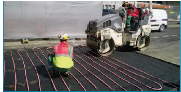
Figuras 5 y 6. Instalación de los tubos por hincado