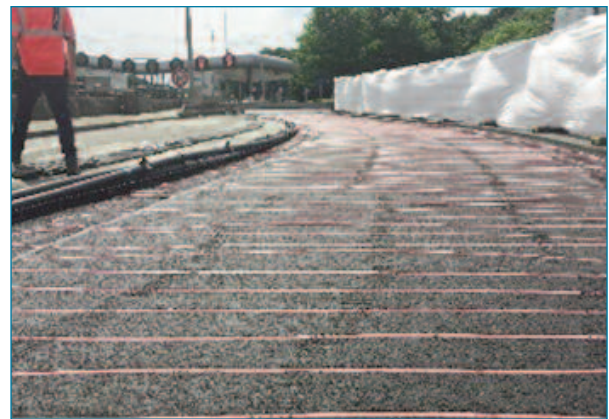
Figura 7. Aspecto tras la hincado

Este método de instalación permite una implementación de manera rápida, por lo tanto, es particularmente adecuado en vías donde, para su ejecución, es necesario cortar totalmente al tráfico la carretera. Si la instalación se realiza sobre una calzada existente, será necesario fresar la capa de rodadura y la intermedia