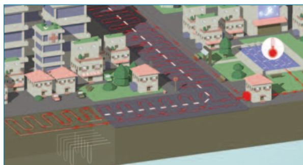
Figura 4. Ejemplo de aplicación de la energía térmica para calentamiento de piscinas

tro comercial. En este caso, el dimensionamiento del pozo geotérmico deberá tener en cuenta esa energía térmica producida por la calzada.