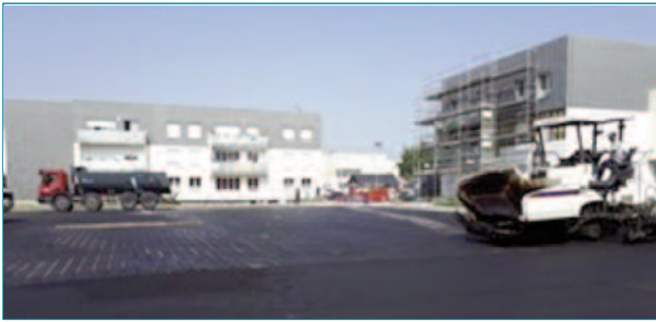
Figura 16. Instalación de los tubos en el aparcamiento

consumo). La fase de estudio detallado pudo llevarse a cabo en un período de tiempo corto, de octubre a diciembre de 2018. En noviembre de 2018, se hizo una perforación de prueba y la respuesta térmica permitió validar la modelización geotérmica y, por tanto, el tamaño del campo de sondas y el área de Power Road® a instalar.