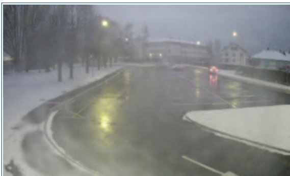
Figuras 12 y 13. Aspecto del aparcamiento en enero