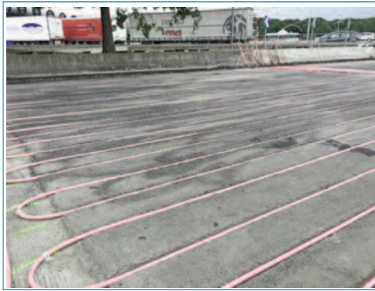
Figuras 10 y 11. Instalación de los tubos mediante hincia