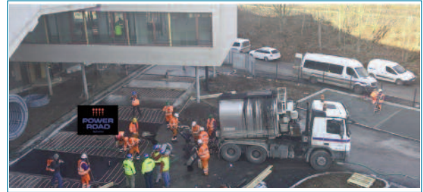
Figura 14. Instalación Power Road® en Praga