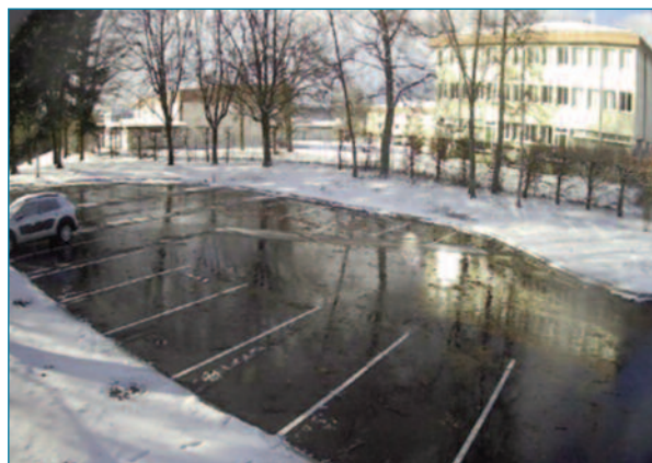
Figura 3. Aplicación de Power Road® en un aparcamiento para fundir la nieve

Este sistema puede acoplarse a un segundo intercambiador de calor de tal manera que la energía almacenada, pueda destinarse a otras aplicaciones, ampliando mucho el abanico de posibilidades de empleo como podría ser, por ejemplo, el acondicionamiento térmico de un cen-