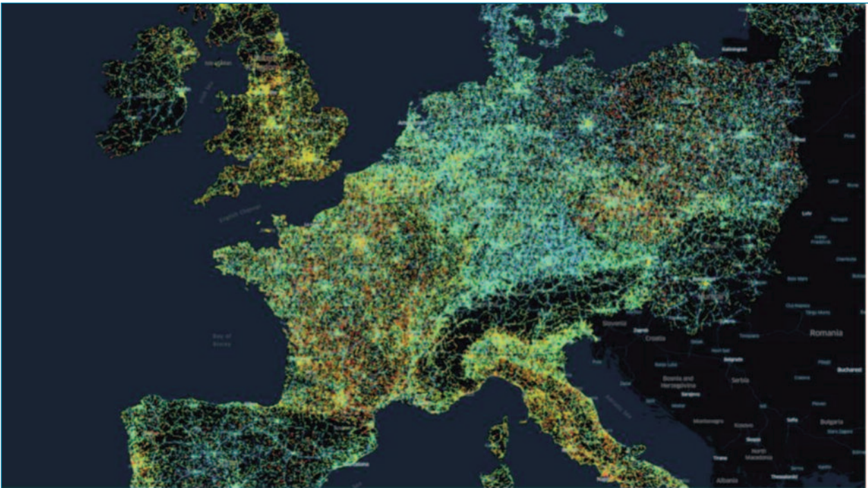
Densidad de la toma de datos procedentes de vehículos.

dría ser el equivalente a que cada x años se cambiase el método de medida, sustituyendo el IRI por otro parámetro. En este caso, al menos nos quedaría el recurso de hacer estudios de correlación entre parámetros de medida, pero si la información proviene de los fabrican-