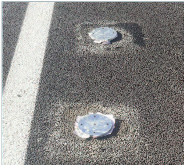
Fotografía disposición de las placas.