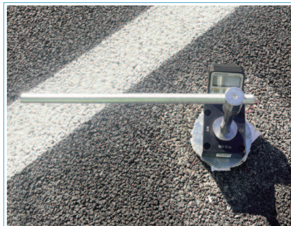
Fotografía equipo torquímetro montado.