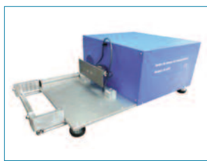
Equipo de ensayo

Conducto de llenado, con dimensiones de (1.000 \pm 50) mm de altura y capaz de albergar al menos 11 kg de mezcla.