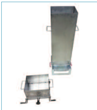
Conducto de llenado y cajón de descarga.

Conducto de llenado, con dimensiones de (1.000 \pm 50) mm de altura y capaz de albergar al menos 11 kg de mezcla.