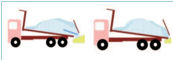
Figura 6. Inicio de descarga

El operador de la extendedora debe controlar el flujo de mezcla que se va descargando, manteniendo la tolva llena, pero sin que desborde por los laterales cayendo al suelo. Estas ca das de mezcla, en especial las de poca cuant a, que no se retiran, son causa de segregaciones (como m nimo de tipo t rmico), muchas veces no visibles, pues quedan en fondo de capa.