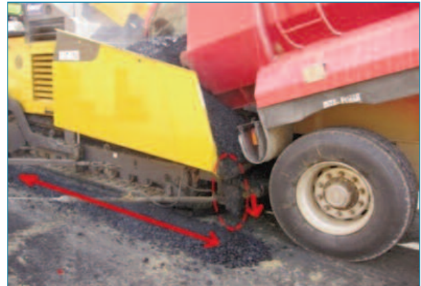
Figura 8. Derrame de mezcla por ineficacia del elemento flexible central de retenci n.

La propia operaci n de descarga de la mezcla exige ciertas pautas y un control de su flujo para evitar segregaciones y derrames por caudal excesivo o desborde por los laterales de la tolva, cayendo al suelo.