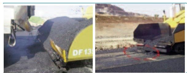
Figura 9. Derrames de mezcla en paradas de entrada-salida de camión.

Al retirarse el camión, tambi n hay que asegurarse de que no cae mezcla delante de la extendedora; cosa que ocurre si la tolva est  aun excesivamente llena o tiene los deflectores frontales de retenci n en mal estado. En ese caso, no debe dejarse en el suelo sino que debe eliminarse o recogerse y reciclarla en la tolva, junto con mezcla caliente del siguiente camión para evitar una zona segregada en la capa. (Fig.8).