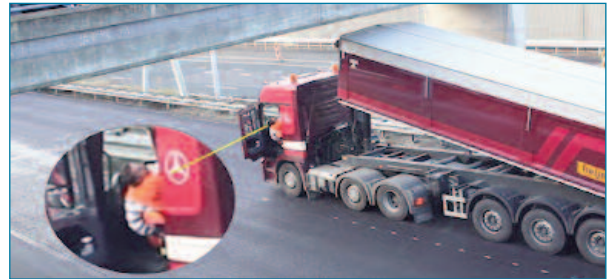
Figura10. Cuidando la elevación de la caja en paso bajo puentes

res, cruces de cables aéreos, cornisas en calles, etc. Por ello, debe prestarse atención, en esos casos, a la salida.