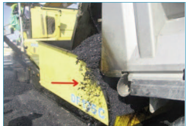
Figura 1. Derrame de mezcla por mala colocaci3n del camión, descentrado e ineficacia del elemento flexible central de retenci3n

Debe estar bien alineado y centrado con el eje de la extendedora; es importante evitar situaciones de mala colocaci3n, que pueden dar lugar a derrames de mezcla por los laterales durante la descarga, por rebose en la tolva. (Fig.1) Por ello, tambi n es importante un buen estado de los retenedores flexibles, de goma, del frontal de la tolva, para evitar derrames.