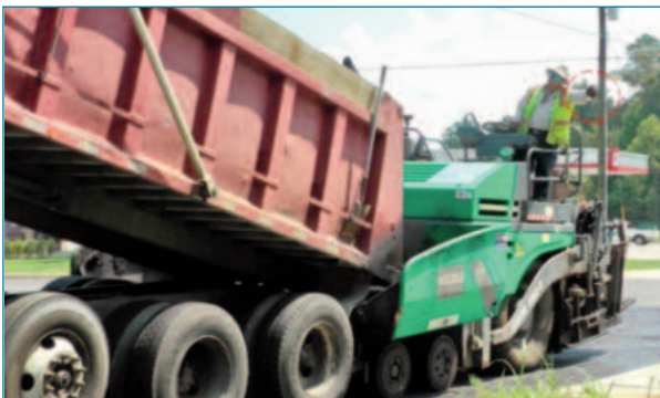
Figura 2. Aproximación dirigida por operador de extendedora.