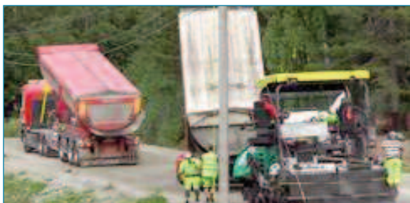
Figura 7. Operaci n de inicio de descarga. Entrada-salida de camión bien ejecutada; levantamiento de caja previo a abrir compuerta en el camión que entra.

La Fig.7 muestra una aplicaci n muy interesante de esta pr ctica, con un camión con caja de fondo curvo que centra la mezcla en la tolva, que ya va iniciando el levantamiento de caja previo a apertura de compuerta durante su aproximaci n a la extendedora, antes de llegar a ella; de este modo se acorta la duraci n de la maniobra; la secuencia completa de este ejemplo de maniobra bien ejecutada se mostrar , m s adelante, en el apdo. 5 .