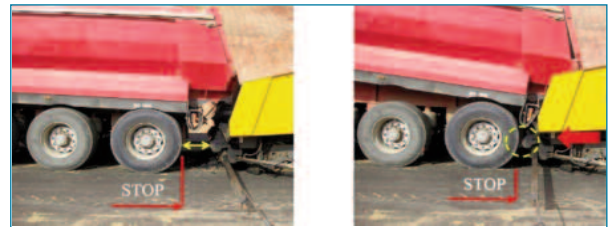
Figura 4. Maniobra de aproximación dirigida y de detención del camión. Parar antes de llegar a la extendedora. La extendedora avanza hasta contactar

Una vez que se ha detenido el camión, la extendedora debe iniciar, o continuar, su avance hasta contactar con las ruedas de aquél. La clave es que debe ser la extendedora la que coja al camión, y no que éste retroceda y choque con aquella, en cuyo caso puede crear marcas de la regla e irregularidades en la capa extendida, (Fig.4).