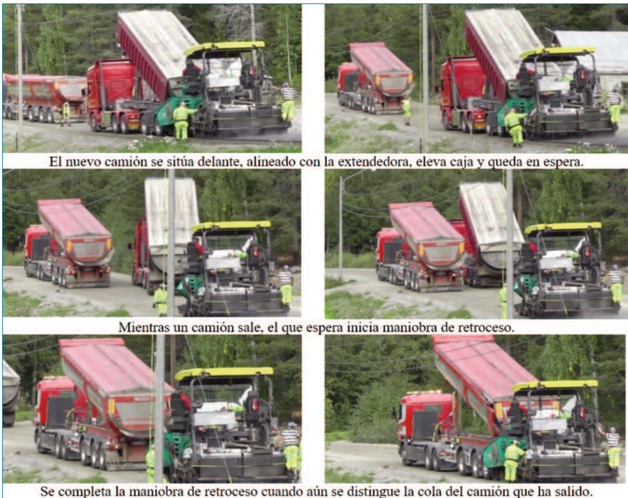
Figura 11. Sincronización de maniobras, minimizando tiempo de parada (Erik Jakobsson)