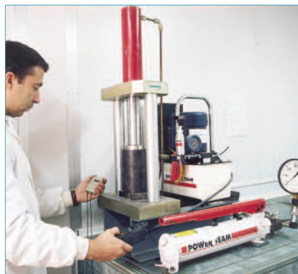
Imagen 3. Compactación de probetas de Inmersión-compresión.

Es un procedimiento sencillo que está a disposición