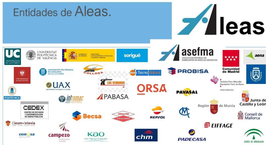
Figura 1: Logos de las entidades miembros de Aleas.