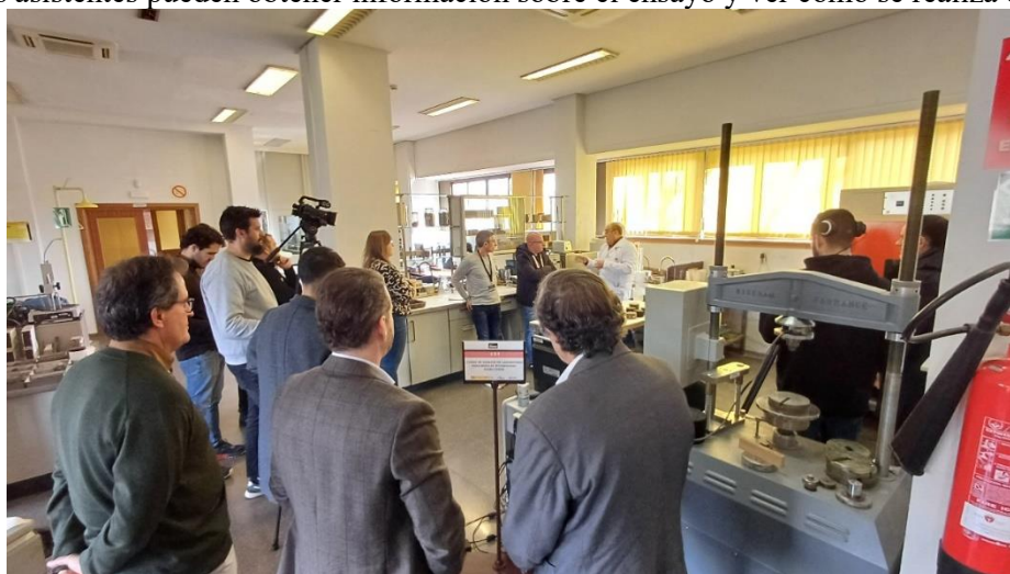
Figura 8: Explicación práctica del ensayo de densidad aparente.

y los equipos de laboratorio que realizan cada uno de los métodos elegidos. Con este sistema todos los asistentes pueden obtener información sobre el ensayo y ver como se realiza cada uno.