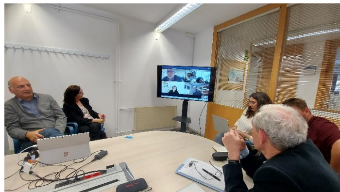
Figura 2: Reuniones de uno de los grupos de Aleas.

El Consejo Gestor se convoca de manera regular para supervisar el avance de las tareas y comprobar si se están cumpliendo los objetivos establecidos desde el principio, además de sugerir el comienzo de nuevos proyectos. Durante las reuniones de seguimiento, se analiza el progreso de las actividades en curso por parte de los diferentes equipos, reasignando o ajustando las responsabilidades y evaluando la participación de los integrantes del grupo.