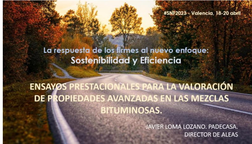
Figura 6: Presentación en jornadas de resultados de los trabajos de los grupos.

A finales del año 2024 se ha iniciado un trabajo de formación, impartiendo cursos híbridos presenciales y retransmitidos por streaming con partes teóricas y partes prácticas de los ensayos que tienen mayor dificultad o que se consideran de mayor interés. Esta actividad que fue realizada en pasado 18 de febrero de 2025, en conjunto con el Centro de Estudios y Experimentación de obras públicas (Cedex) ha quedado grabada para la visualización de cualquier socio de ASEFMA.