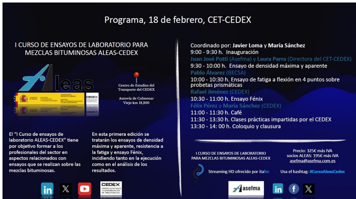
Figura 7: Programa de la primera edición del curso Aleas-Cedex.

A finales del año 2024 se ha iniciado un trabajo de formación, impartiendo cursos híbridos presenciales y retransmitidos por streaming con partes teóricas y partes prácticas de los ensayos que tienen mayor dificultad o que se consideran de mayor interés. Esta actividad que fue realizada en pasado 18 de febrero de 2025, en conjunto con el Centro de Estudios y Experimentación de obras públicas (Cedex) ha quedado grabada para la visualización de cualquier socio de ASEFMA.