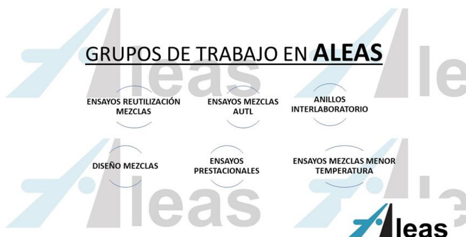
Figura 5: Grupos de trabajo de Aleas.

presentados en el Cila de Granada así como procedimientos técnicos para realizar la calibración y ajuste del agua en los equipos de espumación de betún en las plantas. Se está estudiando la metodología, condiciones y aportando recomendaciones para su empleo en las obras.