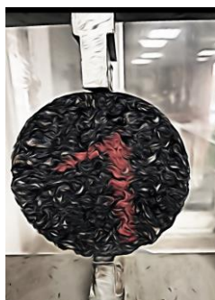
Figura 3: Ensayos de tracción indirecta.

Trabajos como la adaptación del ensayo de inmersión por compresión al nuevo método de sensibilidad al agua, con diferentes tipologías de probetas y procedimientos de rotura, ya sea por compresión o tracción indirecta. Además, se ha realizado la adaptación del ensayo de deformaciones plásticas al nuevo método de rodadura, el cual triplica el tiempo de ensayo. En ambos casos, se ha realizado la transición de la normativa nacional NLT a la normativa europea EN.