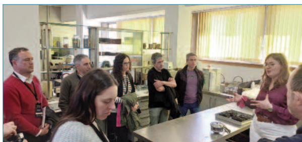
Imagen 9. Clases prácticas.

Tras el receso para el café, se dio paso a la fase práctica con la presentación de los ensayos previamente expuestos. Los asistentes, distribuidos en grupos de diez personas, observaron el procedimiento operativo de cada técnica de la mano del personal de laboratorio del Cedex. Estas demostraciones, dirigidas por los técnicos que desarrollan habitualmente dichas tareas, permitieron un fluido intercambio de opiniones y criterios técnicos entre los especialistas y los participantes.