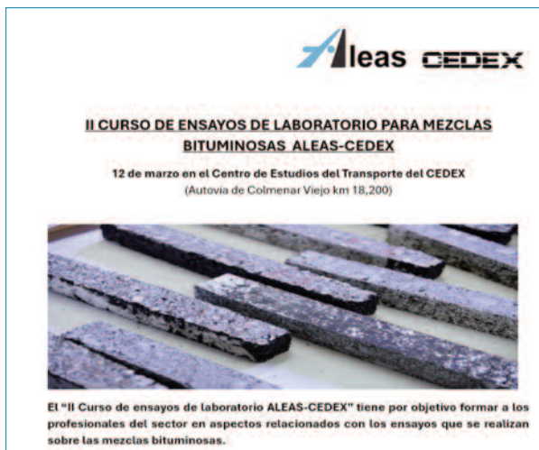
Imagen 1. Publicidad del II curso de ensayos de laboratorio de Aleas-CEDEX

Para cerrar el ciclo de fichas técnicas sobre ensayos de mezclas en la revista Asfalto y Pavimentación , se ha elaborado un artículo especial que recoge las claves de la II edición del curso de ensayos Aleas-CEDEX.