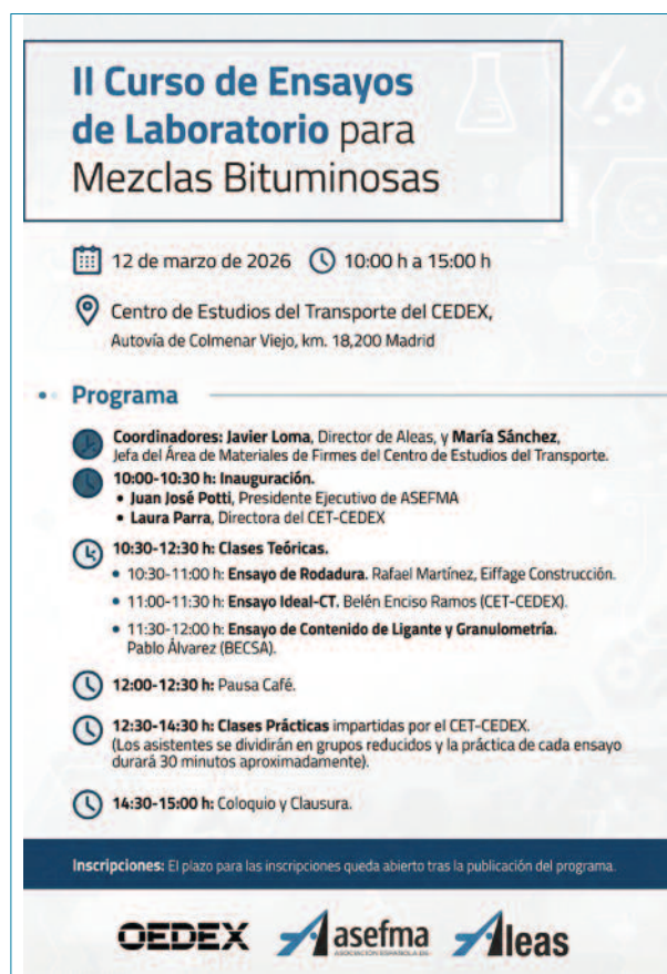
Imagen 2. Programa del II Curso de ensayos Aleas-Cedex.

Como en la edición anterior, el curso se ha celebrado en las instalaciones del CEDEX en los laboratorios del Centro de Estudios del Transporte (CET) en El Goloso (Autovía de Colmenar Viejo, pk 18,2). Para garantizar una formación de alta calidad y un aprendizaje personalizado, la asistencia presencial se ha limitado a un máximo de 30 personas. El programa docente destaca por su excelencia; mientras que la carga teórica es impartida por tres profesionales de reconocido prestigio en el sector, la formación práctica corre a cargo de los propios técnicos especialistas del CEDEX, asegurando una trans-