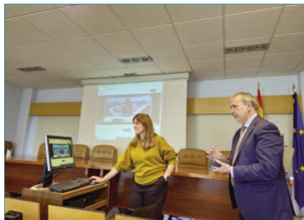
Imagen 10. Despedida del curso.

La jornada concluyó con un coloquio participativo entre los asistentes presenciales, seguido de las palabras de despedida y agradecimiento de los coordinadores del curso. El grado de satisfacción con respecto al desarrollo y los contenidos técnicos fue absoluto. Ante el éxito de la convocatoria, se planteó formalmente dar continuidad a este programa formativo con nuevas ediciones en los próximos años.