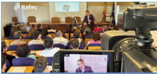
Imagen 5. Retransmisión por streaming del curso.

Tras la sesión inaugural, se dio paso al bloque técnico de ponencias, las cuales fueron retransmitidas en directo vía streaming para toda la audiencia virtual.